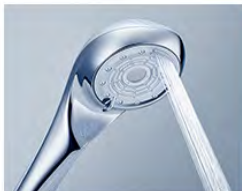
ポイントジェット

驚くほどきめ細かく包まれる ようなミストで、ふんわりや さしく洗いあげます。顔など の刺激を避けたい敏感な部分 に。