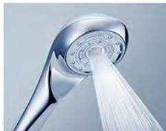
ピュアストレート

ポイント放射で、もっとも水 圧が高い水流。頭皮に使用す れば、爽快なヘッドスパのよ うな体感を気軽に味わえます。